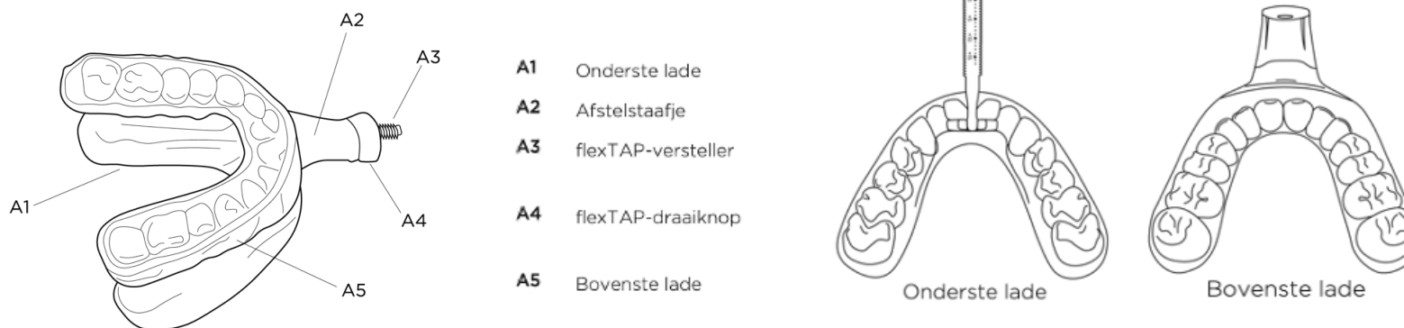
Figuur 1 (afbeelding van onderdelen)

De FlexTAP-schroefknop (figuur 1, A4) stelt de patiënt in staat om de hoeveelheid protrusie van de onderkaak aan te passen naar de meest effectieve en comfortabele positie. Elke halve draai (tegen de klok in “vanuit het perspectief van de gebruiker”) van de flexTAP-draaiknop vergroot de protrusie met een stap van 1/3 mm.