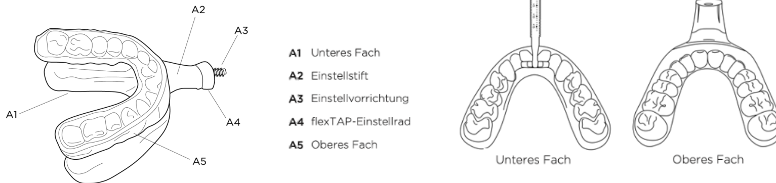
Abbildung 1 (Abbildung der Teile)

Das flexTAP-Einstellrad (Abbildung 1, A4) ermöglicht es dem Patienten, die Protrusion des Unterkiefers auf die effektivste und bequemste Position einzustellen. Jede halbe Drehung (gegen den Uhrzeigersinn „aus der Perspektive des Anwenders“) des flexTAP-Einstellrads bewirkt eine Verschiebung der Position in Abständen von 1/3 mm.